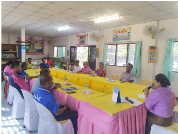
ภาพการประชุมชี้แจงนโยบาย No Gift Policy กับคณะกรรมการสถานศึกษา