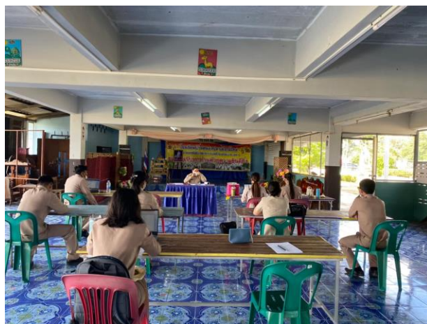
ภาพการประชุมชี้แจงนโยบาย No Gift Policy